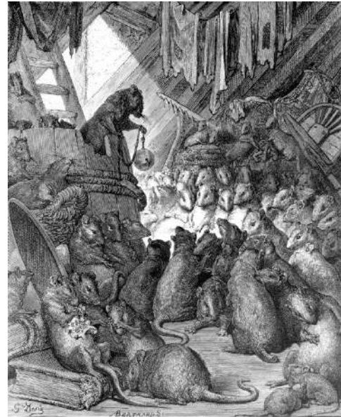
The council of rats- Gustave Dore

Wat volgt zijn 15 verzen uit het Crombrugs handschrift in Middelnederlandse taal. De verzen gaan nog steeds over het verhaal "van den vos reynaerde" maar in een andere variant van het nederlands geschreven (middelnederlands vanaf 1380-1425)