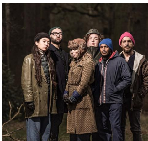
Bevrijden, dat doe je samen! - Olifant, Dolfijn, Edelhert en Giraf

Luisterverhaal met educatieve opdrachten en een online sessie met een paleismedewerker